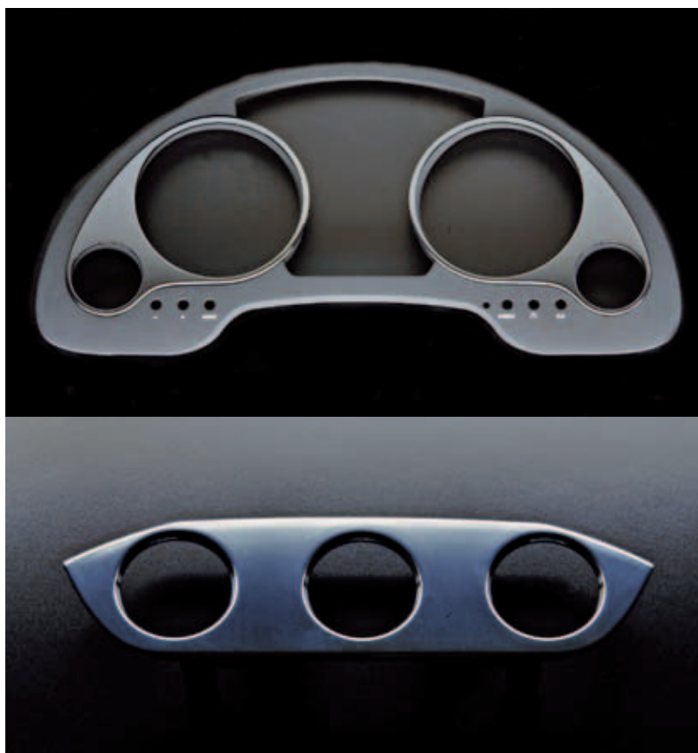
Verkleidungsteile in Schwarz-Chrom-Optik aus dem Automobil-Interieur

Plasma technology rüstete die Vorbehandlungsanlage bei Sommer um